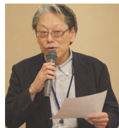
会報委員長 霊山会員