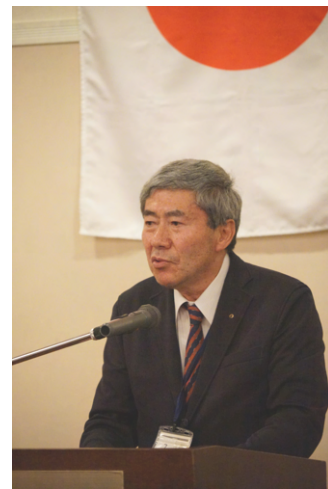
井合会長の今年度の方針説明

開会の前に今回幹事の欠席により代打の司会者により進行された。本例会は会員数59名中35名の出席だった。新年度例会のため国歌斉唱とプロバス讃歌の斉唱 新井合会長より今年度の方針等を兼ねて挨拶をお願いした。