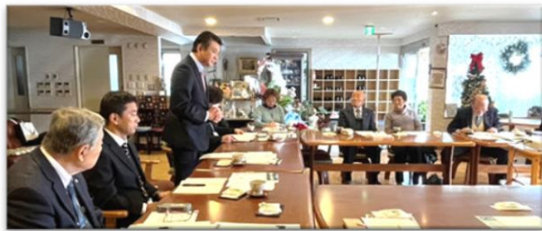
市長と出席の皆さん