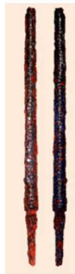
鉄剣 裏 表