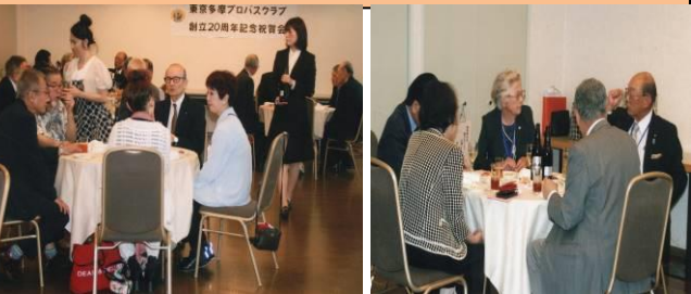
祝賀懇談で大いに盛り上がり楽しいひと時を過ごした