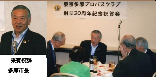
来賓祝辞 多摩市長 阿部裕行様